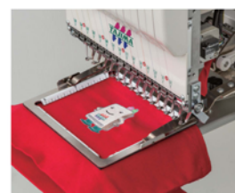
▲Cadre à Air comprimé