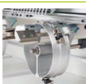
Cadre casquette renforcé

•Le cadre casquette renforcé a permis d'augmenter la stabilité des broderies sur ces supports et obtenir une vitesse de rotation de 1000 points par minute.